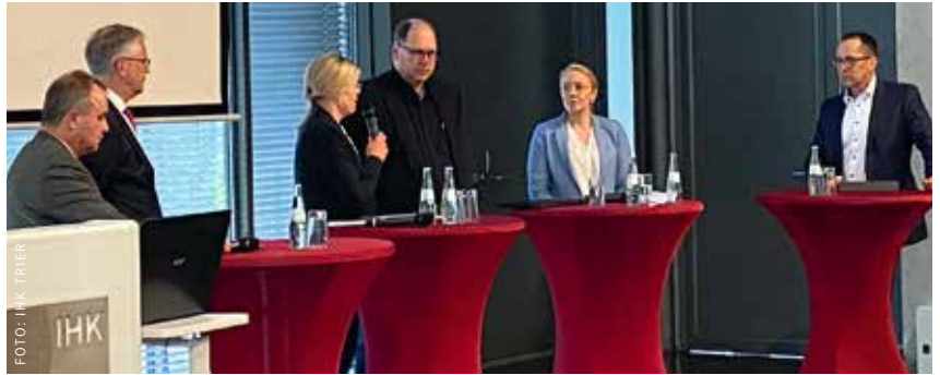
Wie man den Anschluss an eine gute Bahnverbindung nicht verpasst, wurde hier diskutiert.

Auf Basis der Entwicklung verschiedener Kennzahlen diskutierten die Teilnehmer intensiv die Herausforderungen infolge des aktuellen Ukraine-Kriegs und drastisch steigender Kosten, die für Unternehmen zunehmend zu einer Existenzbedrohung wird. Auch über das sich seit einigen Jahren zuspitzende Problem des