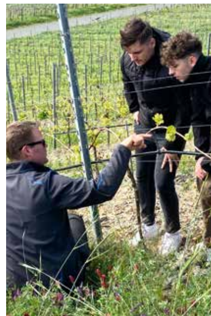
Im Weinberg das Wachstum der Reben verfolgen.

Veranstaltungsprogramm des regionalen Ausbildungskonzepts HOGANEXT. Mit Veranstaltungen, die speziell für die Bedürfnisse der Auszubildenden konzipiert wurden, sollen diese über die alltägliche Tätigkeit im Ausbildungsbetrieb hinaus qualifiziert werden, indem vorgelagerte Wirtschaftsbereiche unter die Lupe genommen werden. Das Konzept wird seit 2020 von der IHK Trier durchgeführt und seit diesem Jahr auch in der IHK-Region Koblenz angeboten.