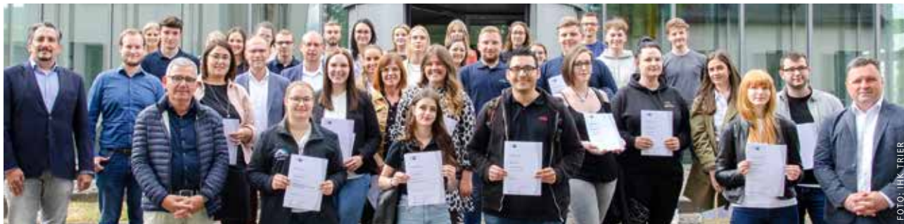
Die ausgezeichneten Auszubildenden mit ihren Urkunden.

Azubi-Teams überzeugen beim ersten Klimaschutz-Wettbewerb der IHK Trier