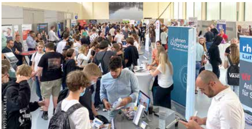
Die Ausbildungsmesse in Traben-Trarbach war ein voller Erfolg.

Dazu hat IHK Trier ihren Mitgliedsbetrieben mit dem Vendor Day am 29. Juni 2022 eine Plattform geboten, sich ausführlich über die dazugehörigen