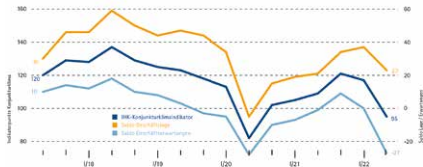
IHK-Konjunkturklima-Indikator für die Region Trier

Aktuell bewerten 37 Prozent der Befragten ihre Geschäftslage mit gut, 49 Prozent mit befriedigend und 14 Prozent mit schlecht. Daraus resultiert ein Lage-Saldo aus Positiv- und Negativvoten von +23, der recht deutlich gegenüber dem Wert der Vorumfrage vom Jahresbeginn mit +37 abfällt, sich aber insgesamt noch im „grünen Bereich“ bewegt. Weitaus dramatischer gestaltet sich die Entwicklung der Geschäftserwartungen für die kommenden zwölf Monate. Während sich zu Jahresbeginn Optimisten und Pessimisten mit jeweils 17 Prozent noch exakt die Waage hielten, liegt das Verhältnis nun bei 14 Prozent zu 41 Prozent, was einem Geschäftserwartungssaldo von -27 Punkten entspricht. Die Unternehmen werden zunehmend von Rezessionsorgen geplagt, die in Industrie und Handel stärker ausgeprägt sind als