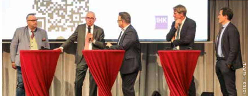
Sachlich fundierte Argumente wurden bei Diskussion des Wirtschaftsforums ausgetauscht.

Präsident Peter Adrian betonte gleich zu Beginn: „Die Wirtschaft steht hinter den beschlossenen Sanktionen gegen Russland und dem beschleunigten Ausbau der erneuerbaren Energien.“ Um dies zu erreichen, sei es unerlässlich Bürokratie abzubauen und Genehmigungsprozesse zu beschleunigen. Damit