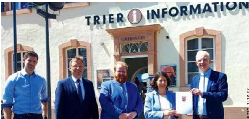
Die Übergabe der Förderzusage für die Tourist-Information in Trier