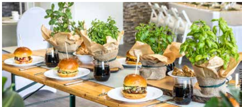
Mietgeschirr kann für manche Veranstaltung eine Alternative sein.

Zeitlose Eleganz, innovatives Design und außergewöhnliche Qualität in den Bereichen Bad und Wellness, Dining und Lifestyle, Wohnen und Fliesen - dafür steht der Name Villeroy & Boch. Der Hersteller von Keramik-waren hat sich