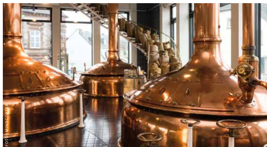
Bitburger Erlebnisswelt Sudhaus