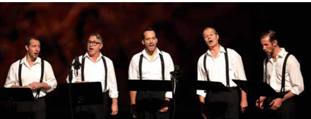
Die „Comedian Harmonists“ des Theaters Trier begeistern mit Ohrwürmern wie „Mein kleiner grüner Kaktus“ das Publikum.