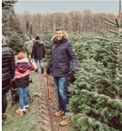
Mit der Säge bewaffnet machen sich die KJUler auf Baumsuche.

Groß und Klein haben sich in diesem Winter (endlich) wieder auf den Weg gemacht und ihren diesjährigen Christbaum an der frischen Luft selbst gesucht und geschlagen. Zahlreiche Jungunternehmer und ihre Familien ließen es sich nicht nehmen, nach zwei Jahren coronabedingter Pause beim KJU-Christbaumschlagen dabei zu sein. Und auch der Weihnachtsmann konnte nicht widerstehen, bei dieser lustigen Runde vorbeizuschauen. In seinem Jutesack hatte er für die Jüngsten die eine oder andere Kleinigkeit dabei, die die Kinderaugen leuchten ließen.