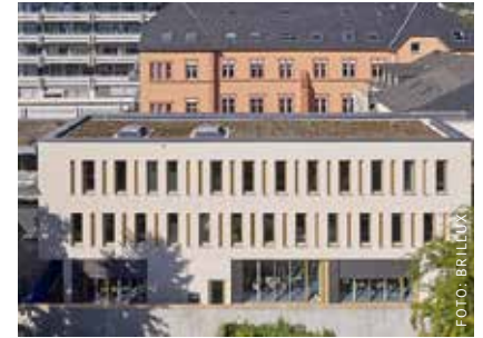
Vorbildlicher Umgang mit dem Denkmal, meisterhafte Ensemblegestaltung: Der Erweiterungsbau der Kinder- und Jugendpsychiatrie des Trierer Klinikums Mutterhaus nutzt die Fassadengestaltung virtuos als prägendes Stilmittel.

Der Erweiterungsbau der Kinder- und Jugendpsychiatrie des Trierer Klinikums Mutterhaus hat mit seiner Fassadengestaltung beim Brillux Design Award 2021 in der Kategorie Öffentliche Gebäude gesiegt. Die Eigentümerin, das Klinikum Mutterhaus der Borromäerinnen, wurde zusammen mit dem Team der Firma Dahm, Maler-Putz-Gerüstbau aus Berncastel-Kues, und dem beteiligten Architekturbüro für die gemeinsame Leistung am Objekt mit der höchsten Ehrung ausgezeichnet. Die feierliche Preisverleihung des Wettbewerbs 2021 fand in diesem Herbst in Münster statt.