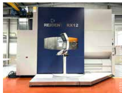
Das Bearbeitungszentrum Reiden RX12 verfügt über modernste Ausstattung und bietet ein modulares Automationskonzept auf kleinstem Raum. Es ist eine der wichtigsten Investitionen, die FELUWA in den vergangenen Jahren in den Standort Mürtenbach getätigt hat.

Nach vier Wochen Zusammenbau von 31 Tonnen Gesamtgewicht der Einzelteile,