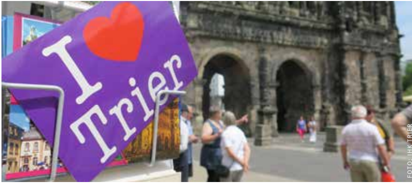
Die Umgestaltung des Porta-Nigra-Vorplatzes ist eines der viel diskutierten Projekte der Stadtentwicklung.