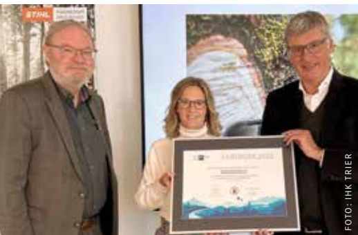
Eine Ehrenurkunde der IHK für 50 Jahre STIHL.