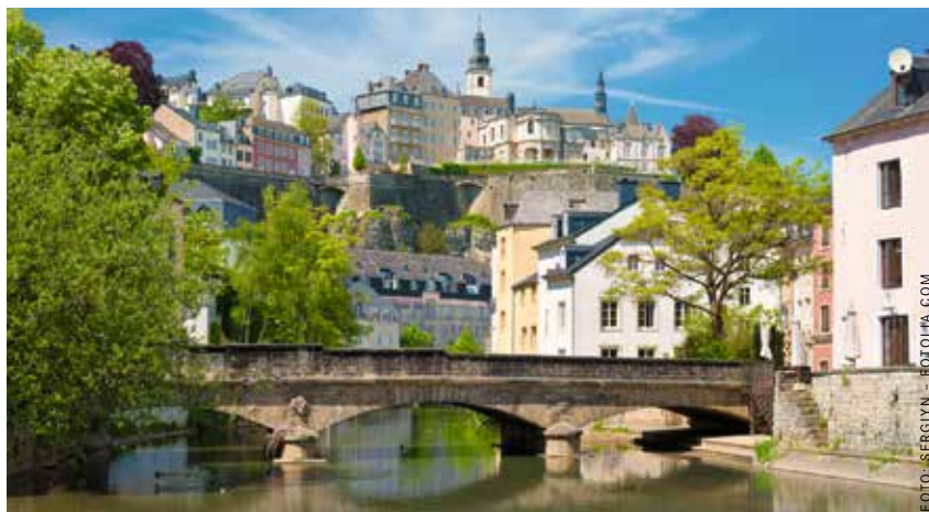
Die EIC Trier GmbH lädt zum Seminar „Unternehmensgründung in Luxemburg“.