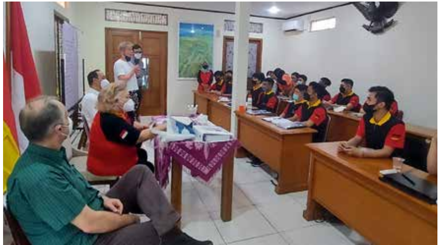
In ihrer Heimat erhalten die jungen Indonesier eine gezielte Vorbereitung für ihre Ausbildung in Deutschland. Dazu zählen Sprachkurse, Workshops zum Leben und Lernen in Deutschland und Infos rund um die verschiedenen Ausbildungsberufe im Gastgewerbe.

im Sommer 2019 in Indonesien geführt. Durch Corona geriet das Vorhaben ins Stocken und konnte erst im Herbst 2021 konsequent vorangetrieben werden.