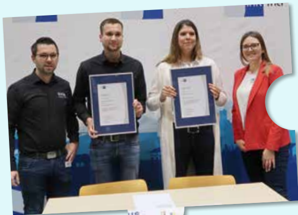
Volksbank Eifel eG und das Sankt Willibrord-Gymnasium Bitburg,