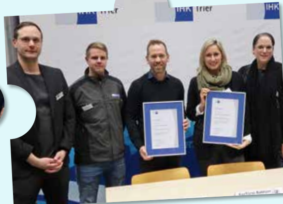
NATUS GmbH und Co. KG und die Integrierte Gesamtschule Trier sowie