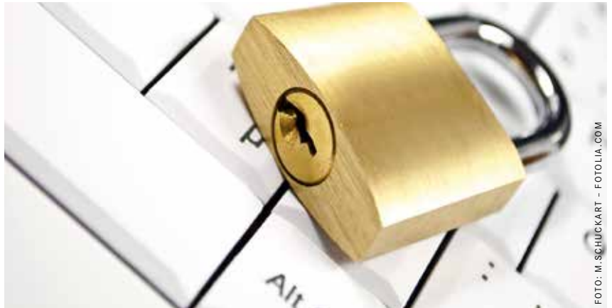
Der Datenschutz spielt auch bei der Personalarbeit eine immer wichtigere Rolle.

Die EIC Trier GmbH bietet am Mittwoch, 24. Mai, ein Webinar zum Thema „HR-Compliance im Datenschutz: Fokus Deutschland/Luxemburg“ an. Der Beschäftigtendatenschutz ist unerlässlicher Teil der Personalarbeit geworden. HR-Prozesse werden digitalisiert, die technischen Möglichkeiten kennen kaum mehr Grenzen. Dennoch sind aus Sicht der Datenschutzbehörden zahlreiche digitale Instrumente rechtswidrig. Von der digitalen Bewerberauswahl, dem „Onboarding“ bis zum „Offboarding“ ist auf datenschutzkonforme Ausgestaltung zu achten. Verstöße gegen die Datenschutzbestimmungen können zu massiven Bußgeldern führen, aber auch zu verlorenen Investments, wenn eine Datenschutzbehörde ein lang erprobtes Tool für rechtswidrig hält. Daher sollten sich Unternehmen intensiver denn je mit den datenschutzrechtlichen Rahmenbedingungen im HR-Bereich beschäftigen. Von 10:00 bis 12:30 Uhr vermittelt das Webinar das Know-how für den