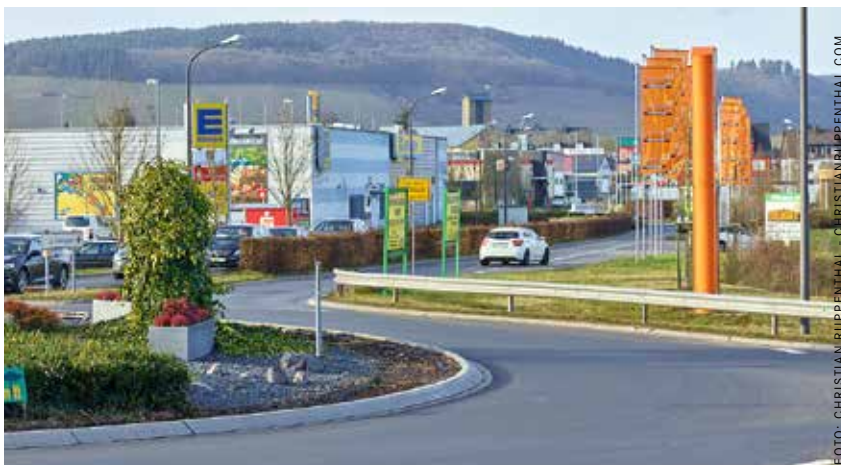
Die Gestaltung von Gewerbegebieten steht im Fokus einer Webinar-Reihe.

Die umsatzsteuerliche Einordnung von innergemeinschaftlichen Lieferungen, Werk- und Montagelieferungen sowie von grenzüberschreitenden