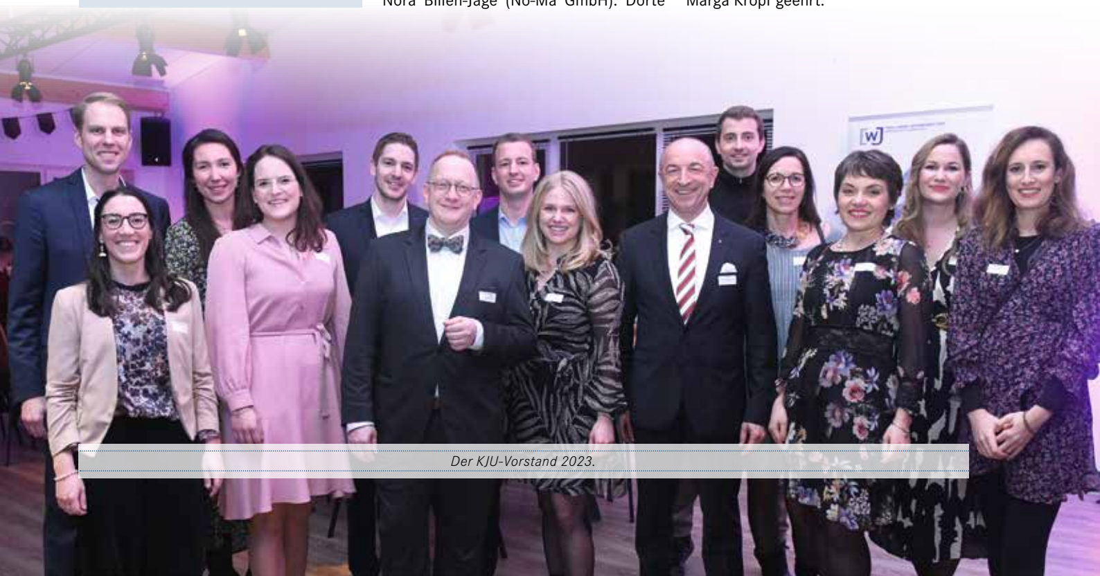
Der KJU-Vorstand 2023.

Kontakt & Info: KJU-Geschäftsstelle, Telefon: (06 51) 97 77-5 60, Fax: -5 05, E-Mail: info@kju-trier.de www.kju-trier.de