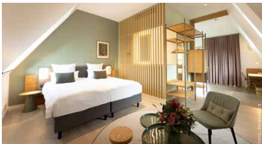
Die Zimmer im DEINHARD'S stimmen bis ins Detail: Elemente wie das Material Kork oder Bacchus-Lampen greifen das Thema Wein gekonnt auf.