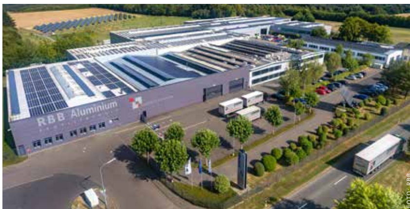
Nachhaltigkeit ist ein großes Thema bei RBB in Wallscheid. Das Unternehmen investiert nun unter anderem in den bestehenden Freiland-Solarpark.

Darüber hinaus hat die RBB-Gruppe den Auftrag zur Erweiterung des bestehenden Freiland-Solarparks um 2,1 MW erteilt. Die Baumaßnahmen sind für das Frühjahr 2023 geplant. Das Investitionsvolumen beträgt 2,5 Millionen Euro. Insgesamt werden dann am Standort Wallscheid 3,6 MW Strom erzeugt. Für RBB Aluminium hat die ökologische Verantwortung eine zentrale Bedeutung; Nachhaltigkeit ist bei allem ein wichtiger Grundsatz. Schon seit dem Jahr 2007 setzt sich das Unternehmen intensiv mit dem Thema auseinander. Durch eine eigene Nachhaltigkeitsstrategie, die insbesondere auf die Förderung von erneuerbaren Energien in Verbindung mit dem Schutz der natürlichen Umwelt zielt, hat RBB Aluminium einen eigenen ökologischen Fußabdruck definiert. „Wir haben uns zur Aufgabe gemacht, unseren verantwortlichen Beitrag für eine bessere Umwelt zu leisten“, erklärt Alexander Beu.