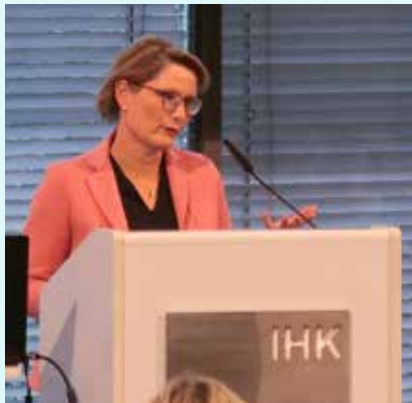
Bildungsministerin Dr. Stefanie Hubig zu Gast beim IHK-MINT-Forum.

Besucher des IHK-MINT-Forums legen Grundstein für neue Bildungspartnerschaften