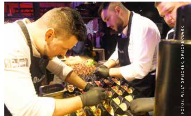
KJU-Jahresmitgliederversammlung in der Hall of Taste.