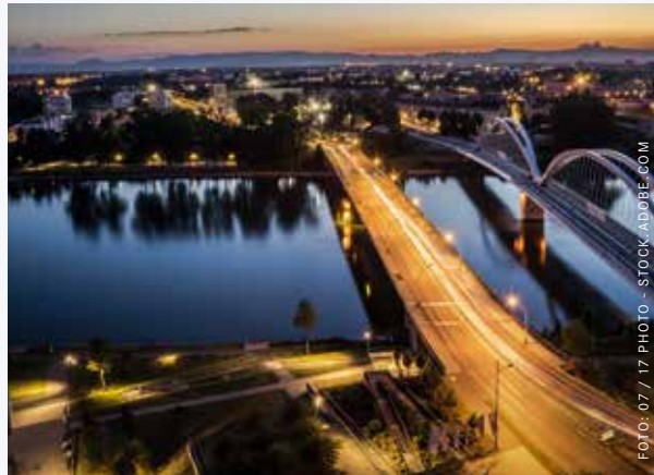
Der gemeinsame Binnenmarkt soll innerhalb der EU Brücken schlagen – wie hier in Straßburg zwischen Deutschland und Frankreich.