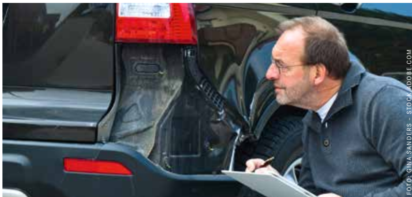
Sachverständige sind gefragt, insbesondere in den Bereichen KFZ-Wesen, Bauwesen und Immobilienbewertung.

Landesweite Kampagne zur Nachwuchsgewinnung von öffentlich bestellten Sachverständigen startet