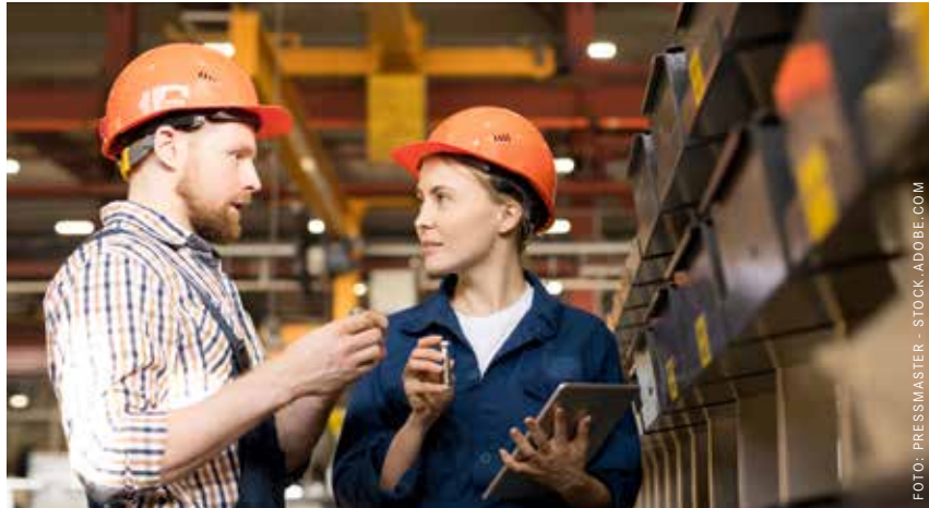
Viele Firmen würden gerne zusätzliches, qualifiziertes Personal einstellen.

Die befragten Kleinstunternehmen konnten jede fünfte Stelle nicht passend besetzen, bei den Kleinunternehmen war es jede zehnte, während mittelgroße Firmen mit 50 bis 249 Beschäftigten bei jeder 20. Position leer ausgingen und