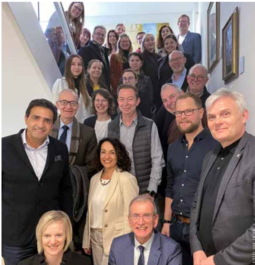
Austausch am Nationalpark-Tor: die IHK-Tourismusarbeitskreise aus Rheinland-Pfalz und dem Saarland.

Das Seminar wurde speziell für die Weinwirtschaft konzipiert, mit dem Ziel, Betrieben eine kostengünstige Durchführung von Exportgeschäften zu