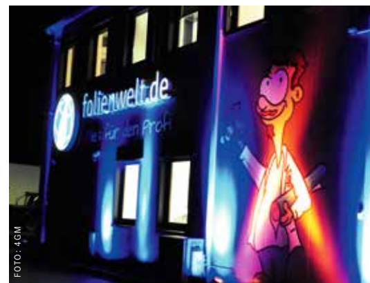
Lichtspiele zur Feier des 15-jährigen Bestehens von 4GM Folienwelt in Trier.

Die Firma 4GM GmbH in Trier hat ihr 15-jähriges Bestehen gefeiert. Als etablierter Großhändler in den Bereichen Werbetechnik, Großformatdruck und Folienverarbeitung hat sich 4GM seit seiner Gründung im Jahr 2008 von einem kleinen Betrieb zu einem bedeutenden mittelständischen Unternehmen entwickelt und beschäftigt aktuell mehr als 35 Mitarbeiter