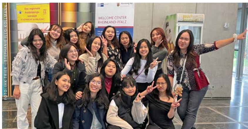
Beim Indonesien-Forum der IHK Trier freuten sich viele Gäste über das Wiedersehen.