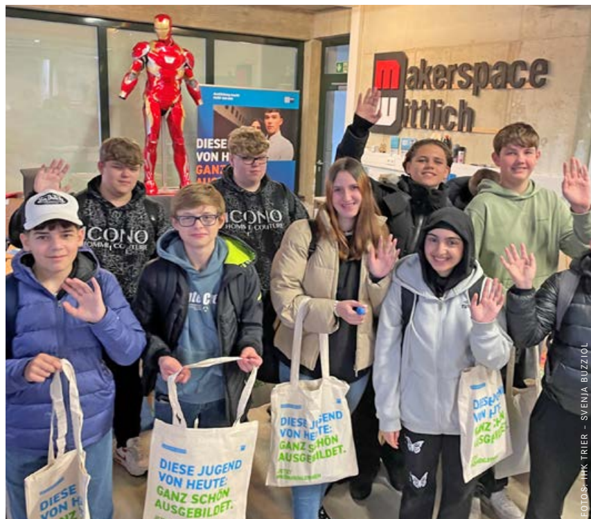
Durchstarten wie ein Superheld: Schüler der Kurfürst-Balduin-Realschule plus in Wittlich nach einem abwechslungsreichen Vormittag im Makerspace.