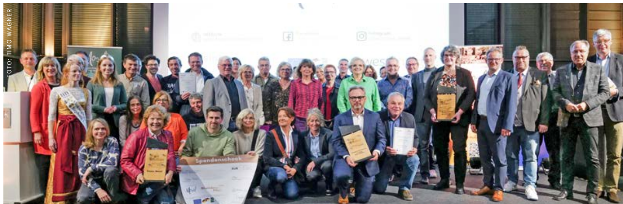
So sehen Moselhelden aus: Ehrung beim Moselkongress im Tagungszentrum der IHK Trier.

Gewinner des Tourismuspreises Rheinland-Pfalz 2024 in der Kategorie „Gastgeber des Jahres“ ist der Ferienhof Hardthöhe aus Oberwesel im Romanischen Rhein. Der Ferienhof hat sich über Jahrzehnte hinweg von einem traditionellen Bauernhof zu einem modernen Family-Farm-Resort entwickelt. Hervorzuheben sind die nachhaltigen Konzepte wie die Nutzung von mobilen Gäste-Tablets, ökologische Bauweisen und eigene Stromerzeugung. Der Ferienhof ist