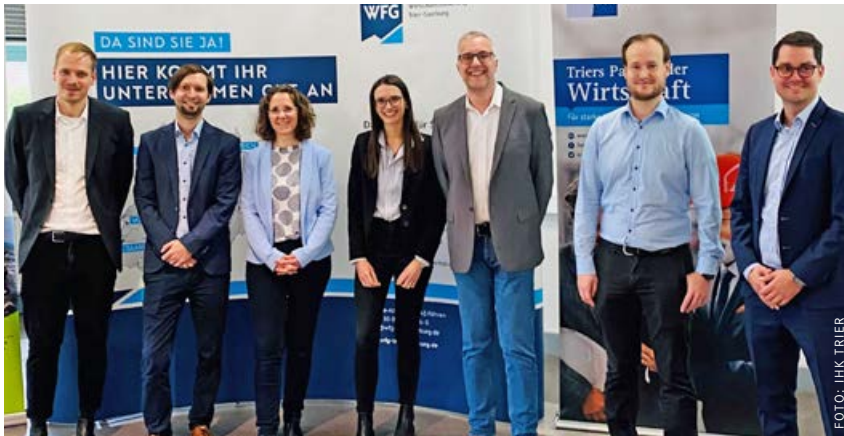
Die Expertinnen und Experten der Wirtschaftsförderungen, ISB, Wirtschaftsministerium und IHK gaben den teilnehmenden Unternehmen einen Überblick, wie man die richtigen Förderprogramme finden, beantragen und nutzen kann.