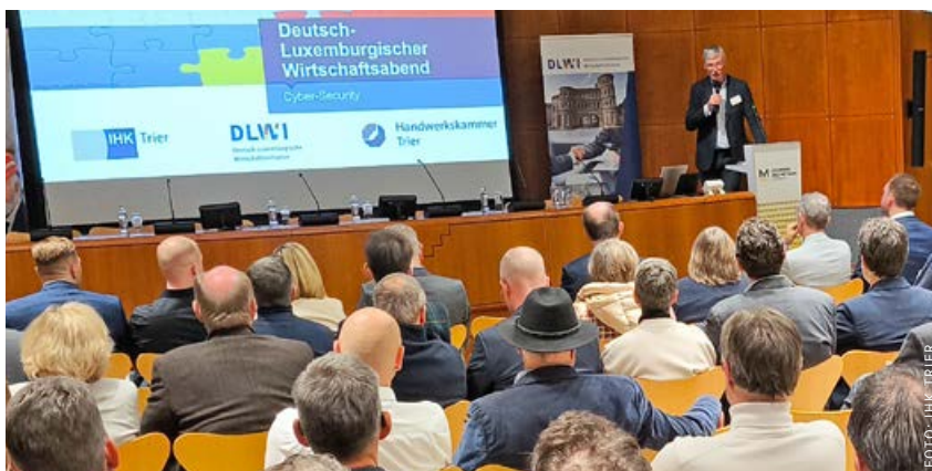
Der Deutsch-Luxemburgische Wirtschaftsabends stand diesmal im Zeichen des Themas Cyber-Security.

Mit dem zunehmenden Einsatz von Künstlicher Intelligenz eröffnen sich neue Möglichkeiten, aber auch Risiken: KI kann Angriffe automatisieren und rund um die Uhr starten. Gleichzeitig unterstützt KI dabei, Bedrohungen schneller zu erkennen, Angriffsstrategien